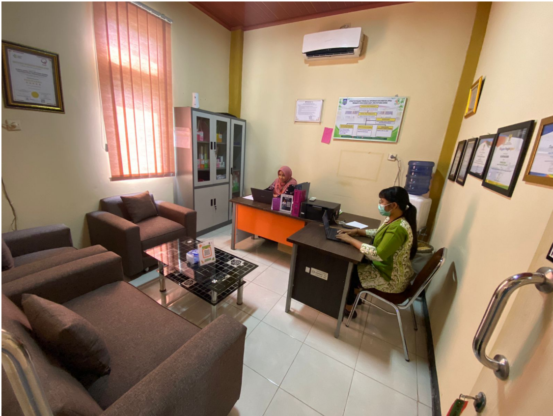
Foto Sarana dan Prasarana PPID Rumah Sakit Jiwa Mutiara Sukma di Sekretariat dan di Poliklinik